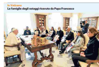
In Vaticano Le famiglie degli ostaggi ricevute da Papa Francesco

Ritaglio stampa ad uso esclusivo del destinatario, non riproducibile.