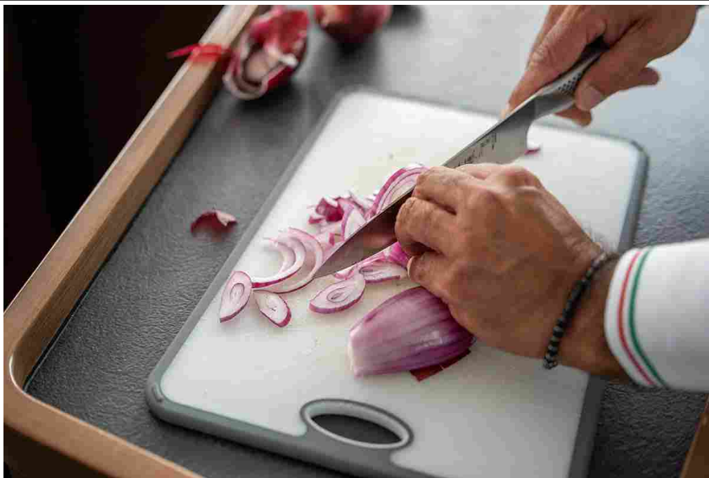
Cipolla Rossa di Tropea è buona e anche sana

Sue le ricette che legano la Cipolla di Tropea a tutti gli altri territori calabresi, ognuno con una sua tipicità e caratteristica di gusto. Da qui la preparazione per una gustosa e succulenta Cipolla Rossa farcita o una deliziosa Cipolla Rossa appassita sui peperoni Cruski di Altomonte . Per i palati più esigenti, poi, c'è la Tartar di Tonno rosso, pomodorini, capperi condita e cosparsa di dadolata di Cipolla di Tropea . E poi ancora i ricercatissimi Rasciadi, una pasta tipica dell'Appennino costiero calabrese , con pomodorini di collina, cipolle IGP di Tropea e ricotta di capra stagionata. Infine il mare per abbinare il re del pescato locale, le alici di Fuscaldo, con la Cipolla Rossa e rigorosamente di Tropea .