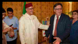
Chi c'era alla Festa del Trono del Marocco.