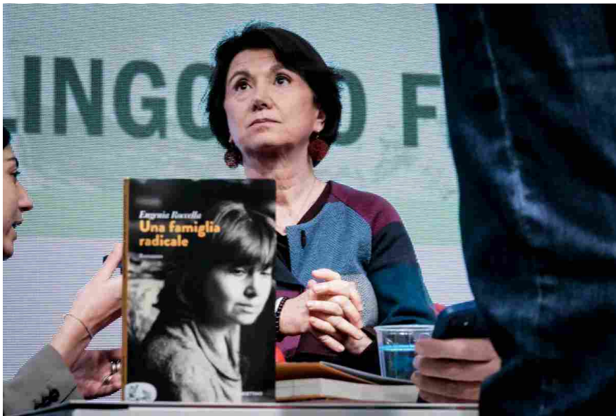
La ministra della Famiglia Eugenia Roccella durante la contestazione al Salone del libro di Torino, 20 maggio 2023

Caterina Giojelli — 24/05/2023 - 6:00 Società