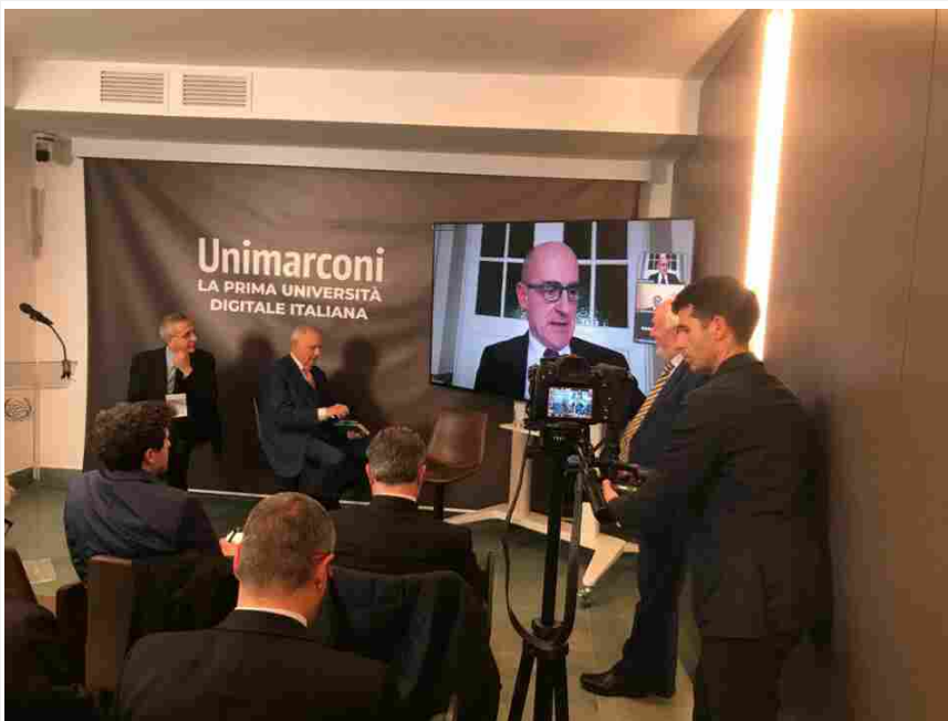
Un momento dell’incontro con gli autori

“È l’uomo il legno storto dell’umanità, non le macchine che inventa. I Big Data, ossia gli immensi patrimoni di dati, sono chiave per un secondo Illuminismo aprendo ad usi superiori dell’intelletto umano e liberando la conoscenza umana dall’arbitrarietà soggettiva, anche se questa rimane una finzione discorsiva in mezzo a una realtà di densa compenetrazione tra i dati e i suoi contesti sociali, culturali e politici. Le piattaforme guidate dai Big Data aprono nuove potenzialità per intervenire e rimodellare le architetture di scelta istituzionali che gli attori del mercato devono affrontare in processi decisionali algoritmici”.