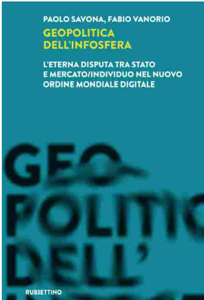
Copertina del libro "Geopolitica dell'Infosfera. L'eterna disputa tra Stato e mercato/individuo nel Nuovo Ordine Mondiale Digitale"