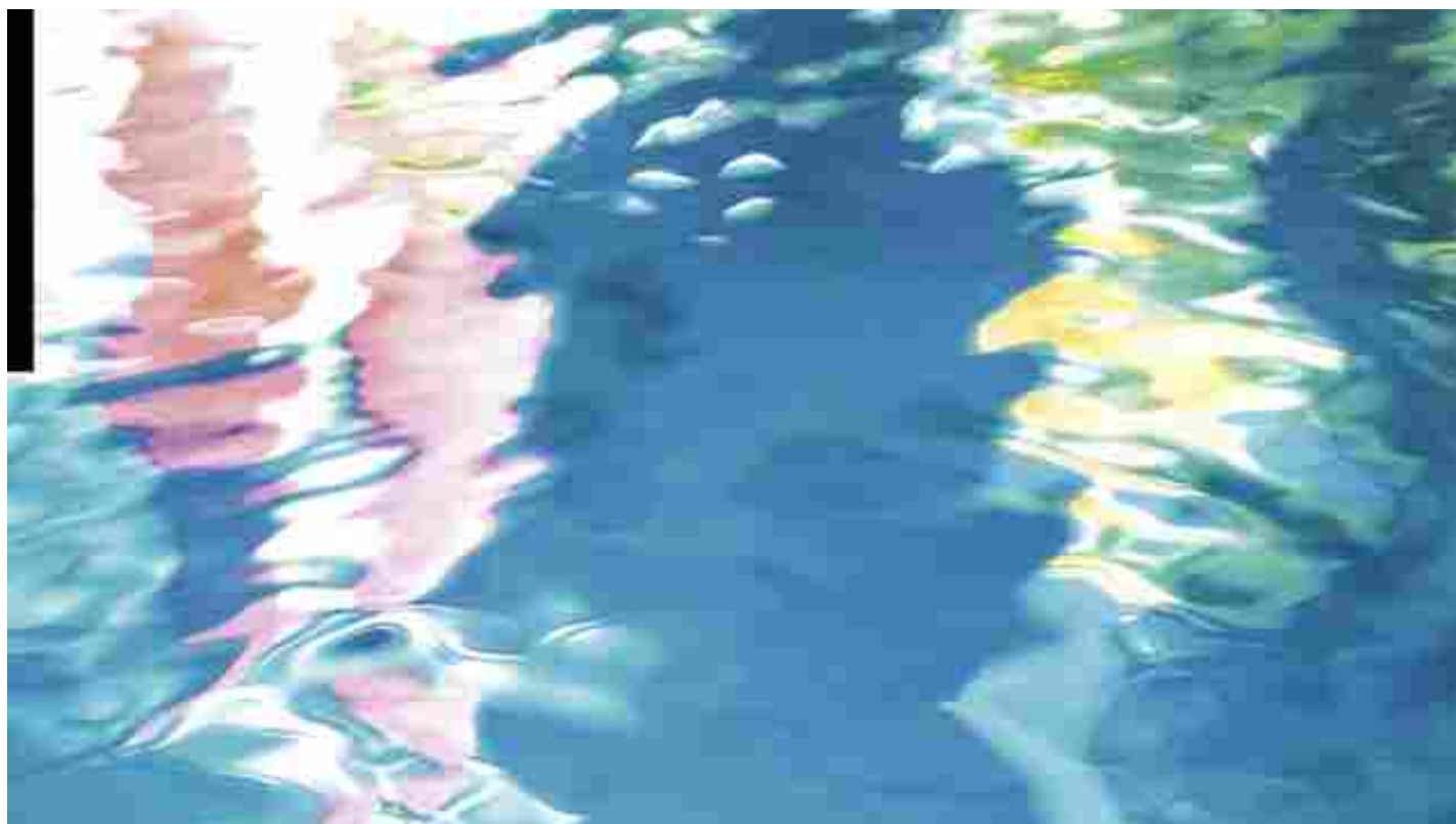
Fiume sacro, di Gianluigi Bruni

I l “Chico Mendes” è un postaccio, alla periferia estrema della città. Il luogo dove si incrociano i destini di esistenze a perdere. Vi si ritrovano una ex detective sfregiata che consuma le sue giornate fra una bevuta e l'altra; una transessuale tenera e sgomenta con il fisico di un lottatore; una femme fatale bipolare ossessionata da un terribile, misterioso pericolo; due strozzini ebefrenici tanto stupidi quanto crudeli. Manca Lui, il francese, il visionario pazzo che ha rubato un mucchio di soldi per costruire da qualche parte lungo il fiume una comune di reietti. Inizia così un'avventura controcorrente, a bordo di una barca malandata su per quel fiume lussureggiante e putrido.