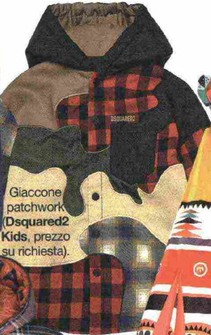
Giaccone patchwork (Dsquared2 Kids, prezzo su richiesta).