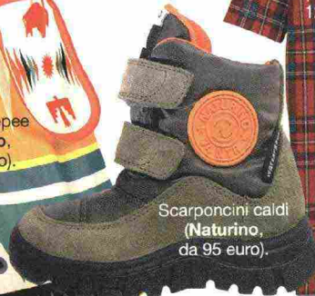
Scarponcini caldi (Naturino, da 95 euro).

Ritaglio stampa ad uso esclusivo del destinatario, non riproducibile.