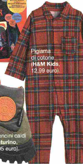
Pigiama di cotone (H&M Kids, 12,99 euro).