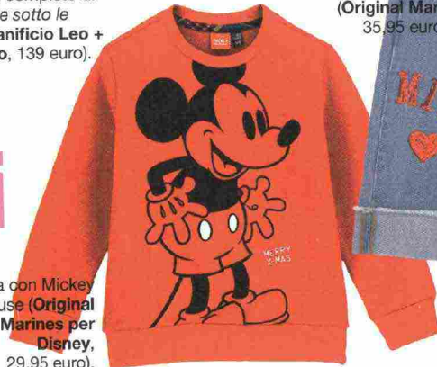
Felpa con Mickey Mouse (Original Marines per Disney, 29,95 euro).