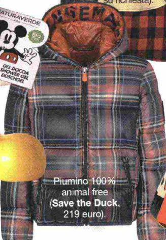
Piumino 100% animal free (Save the Duck, 219 euro).