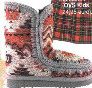
Boots di tessuto kilim (Mou, 219 euro).