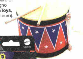
Tamburo di legno (PlanToys, 43,60 euro).