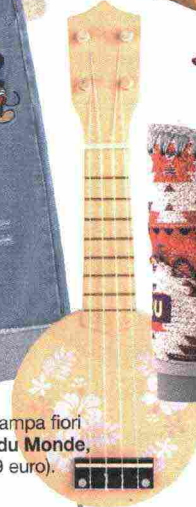
Banjo stampa fiori (Maison du Monde, 25,99 euro).