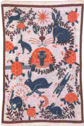
Un plaid "illustrato" da una fiaba e completo di libro ( Favole sotto le coperte , Lanificio Leo + Rubbettino, 139 euro).