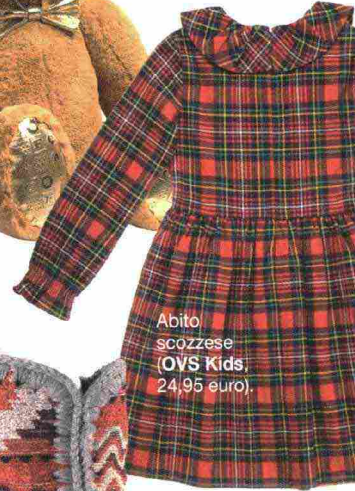
Abito scozzese (OVS Kids, 24,95 euro).