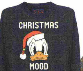
Maglione misto cashmere (MC2 St. Barth per Disney, da 139 euro).