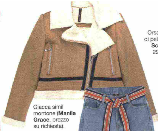
Giacca simil montone (Manila Grace, prezzo su richiesta).