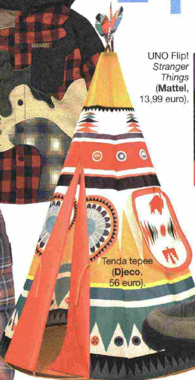
Tenda tepee (Djeco, 56 euro).