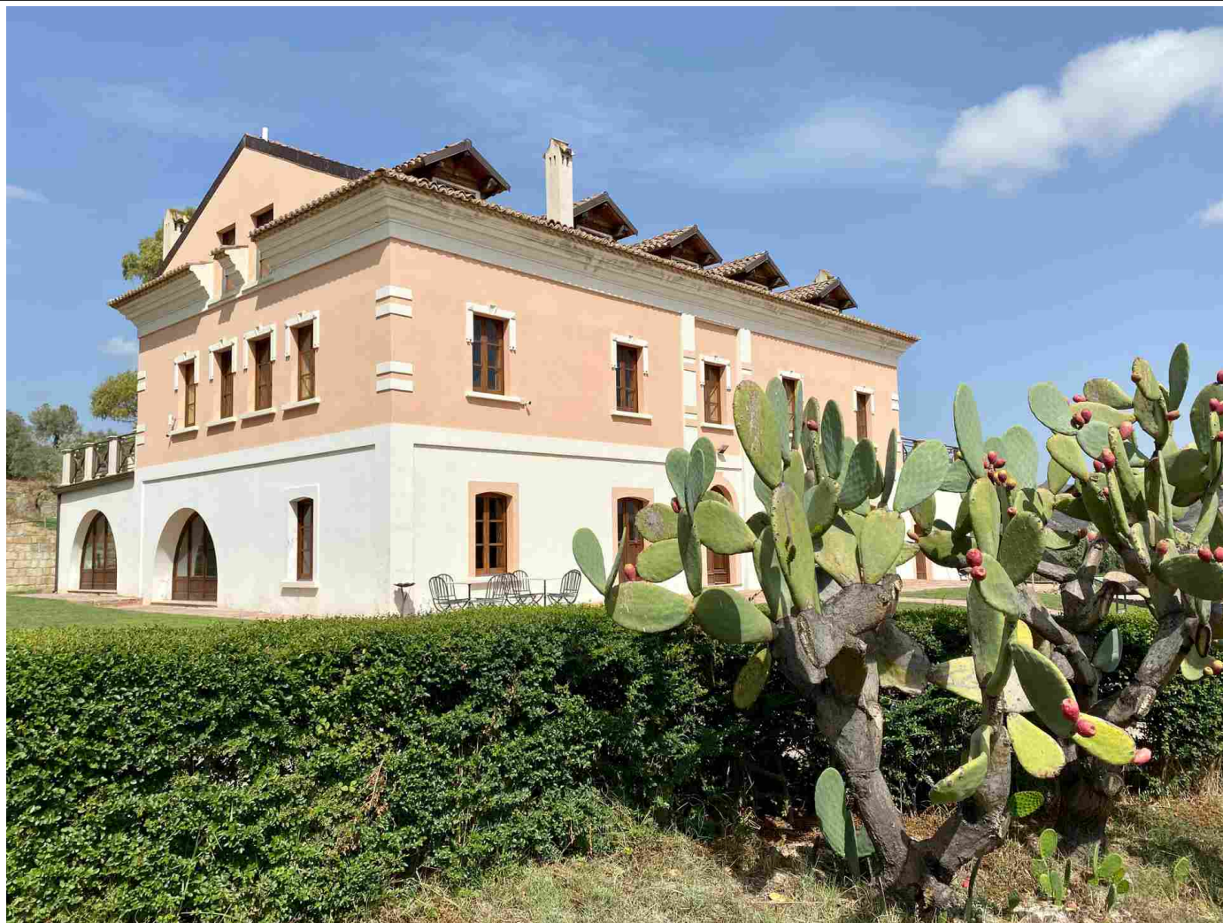
La palazzina sede di Tenuta Rosaneti