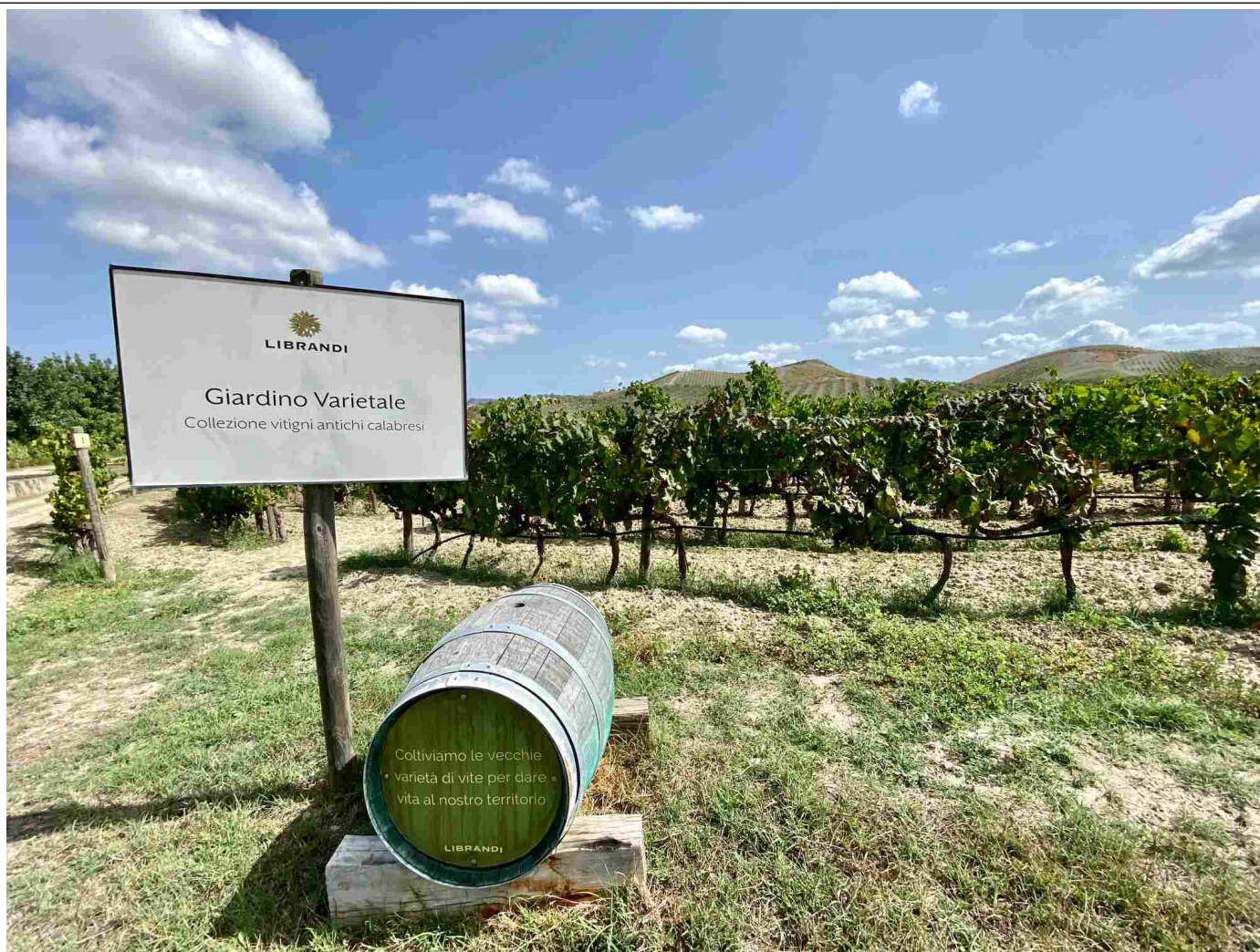
Il Giardino Varietale di Cantina Librandi a Tenuta Rosaneti

Sono, praticamente, tutti i vitigni antichi calabresi (che per comodità di riconoscimento sono stati numerati e inseriti nominalmente in una mappa) che vengono utilizzati nella produzione dei vini dell'azienda. Vini calabresi Igt e Doc.