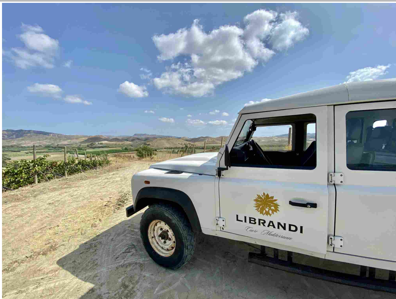
La Range Rover della Cantina Librandi sulla sommità di Tenuta Rosaneti

Tenuta Rosaneti è una delle sei di proprietà della Cantina Librandi , la più grande ed estesa, collocata tra Rocca di Neto e Casabona , in provincia di Crotona: un luogo dove persiste un ecosistema con una variegata biodiversità.