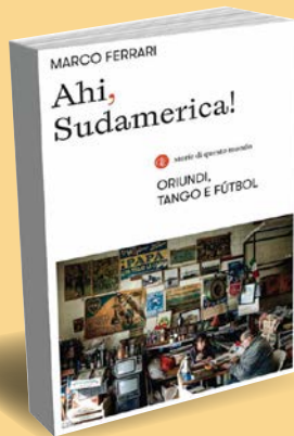
Marco Ferrari Ahi, Sudamerica! Laterza, pp. 264, € 18,00 Formato epub € 9,99

All'inizio del Novecento, Genova e Buenos Aires erano come un'unica città affacciata su due sponde dell'oceano Atlantico. Nella capitale argentina si mangiava, si leggeva e ci si vestiva alla genovese: gli italiani erano più numerosi di tutti gli immigrati degli altri Paesi messi assieme. Sono proprio loro che diffonderanno un nuovo gioco, importato dai marinai inglesi e che farà impazzire tutto il continente sudamericano: il football. In Argentina, Brasile, Venezuela, Uruguay e Paraguay nascono una dopo l'altra mitiche squadre di calcio... Marco Ferrari, giornalista e scrittore spezzino, racconta le storie, esilaranti, malinconiche e struggenti di quei lontani emigranti avendo ben in mente i personaggi bizzarri di Osvaldo Soriano e i malinconici tanghi di Astor Piazzolla.