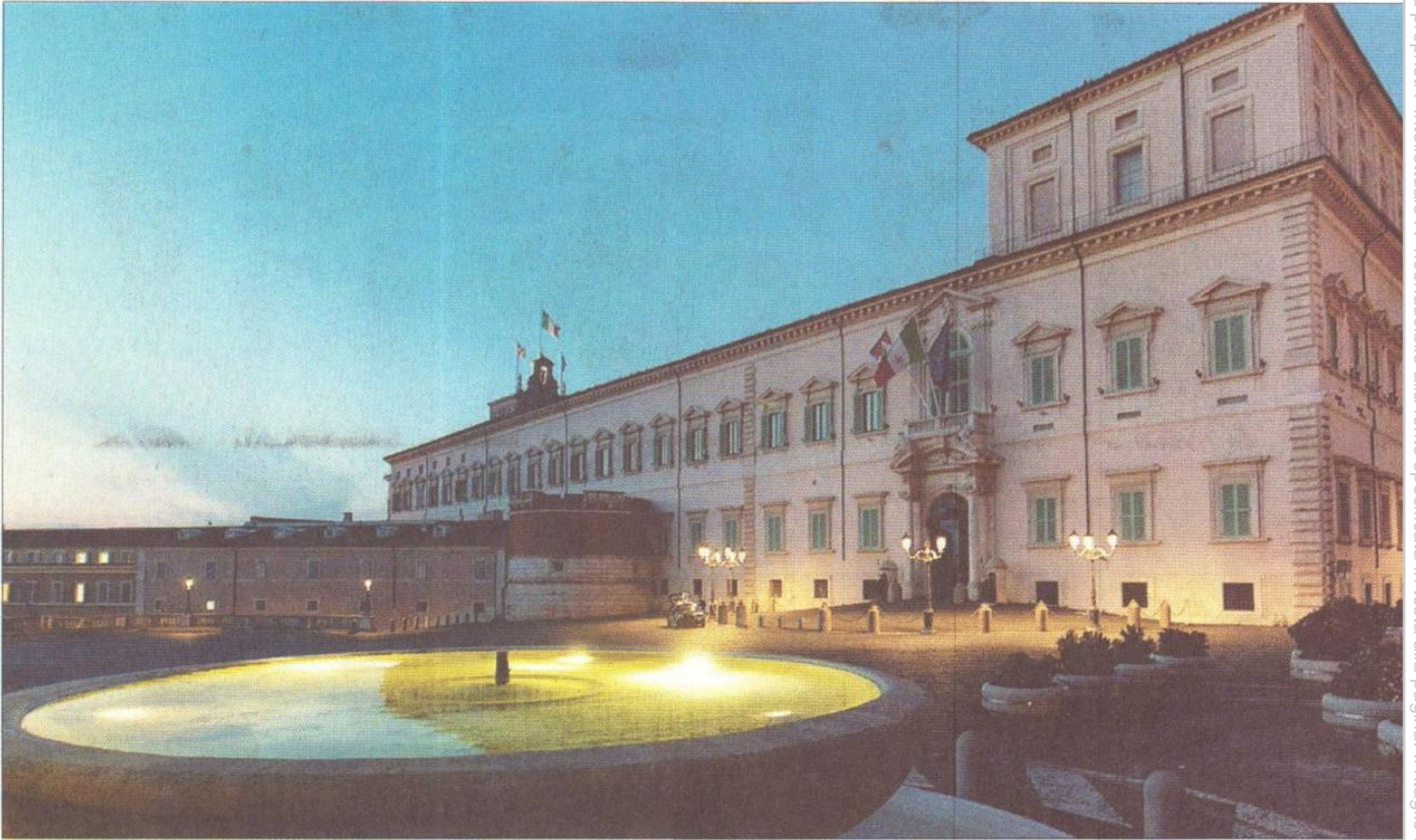
Il palazzo del Quirinale. Sono già cominciate le manovre in vista dell'elezione, nel febbraio 2022, del nuovo presidente della Repubblica