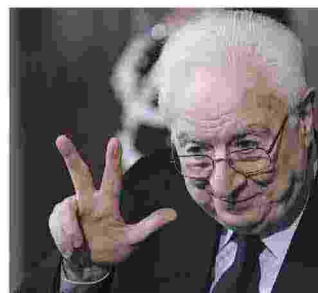
Francesco Cossiga