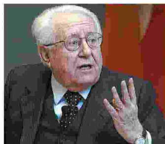
Giuseppe Zamberletti

«Sulla vicenda aleggia la propaganda prima comunista poi piddina: menzogne ripetute mille volte»