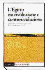
Gianni Del Panta L'Egitto tra rivoluzione e contro- rivoluzione il Mulino pagg. 284 euro 26

Gianni Del Panta, assegnista di ricerca all'Università di Siena, analizza in questo saggio la parabola della rivoluzione egiziana, partendo dai fatti di Piazza Tahrir del 2011, con conseguente caduta del regime di Mubarak, e giungendo fino al colpo di stato militare di al-Sisi del luglio del 2013. Per cercare di capire come ha fatto una rivoluzione iniziata sotto i migliori auspici a finire così male.