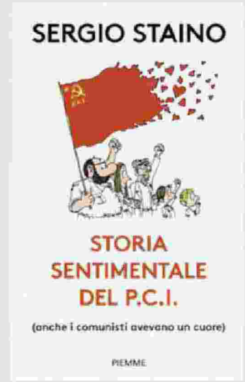
Sergio Staino Storia sentimentale del Pci PIEMME