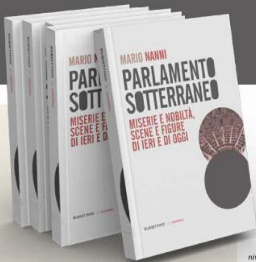
■ Parlamento sotterraneo (Rubbettino)