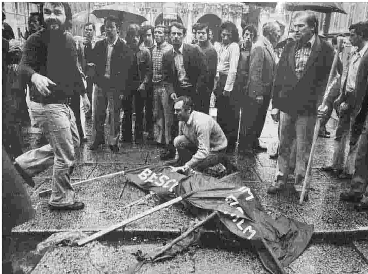
Bombe La stazione di Bologna dopo l'esplosione della bomba il 2 agosto 1980 A lato Piazza della Loggia a Brescia il 28 maggio 1974: una bomba nascosta in un cestino portarifiuti scoppia mentre era in corso una manifestazione