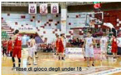
Fase di gioco degli under 18