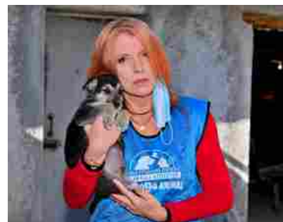
Covid, Leida per l'emergenza sanitaria: 300 animali presi in carico