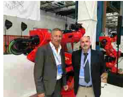
Ex Embraco, Ugl: "C'e' un nuovo progetto, fare in fretta e bene"