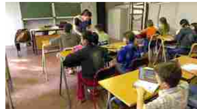
Unicef, giornata mondiale dell'infanzia: al via la campagna social 'Il futuro che vorrei me lo leggi in faccia'