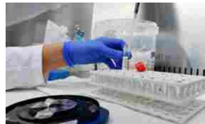
Covid, la situazione in Basilicata: 15 morti e 1.400 positivi