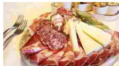
In vigore l'etichetta Made in Italy per i salumi