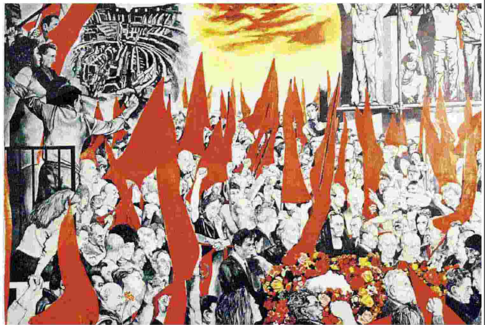
Un dipinto manifesto e icona Renato Guttuso, "I funerali di Togliatti", 1972 (Museo d'arte moderna di Bologna)

Piero Fassino Dalla rivoluzione alla democrazia. Il cammino del Pci 1921-1991 DONZELLI PP. 270, EURO 19