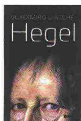
HEGEL. LA DIALETTICA Vladimiro Giacché Diarkos 2020. 18 euro

ducano al risultato sperato. La filosofia non è la storia, che può essere divulgata anche per sommi capi, prestandosi ad essere volgarizzata proprio in quanto parte della ricostruzione narrativa di un passato. Il pensiero filosofico, in termini hegeliani, necessita di un faticoso percorso di apprendimento. Non si presta ad essere ridotto in pillole, e i tentativi giornalistici di "bignamizzare" filosofia e storia hanno condotto in questi decenni a risultati opposti: un trionfo della divulgazione storica e una crisi della comunicazione filosofica.