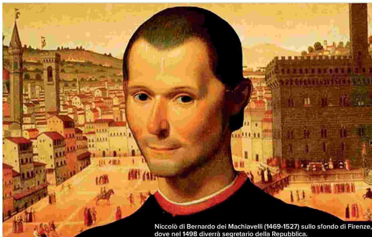
Niccolò di Bernardo dei Machiavelli (1469-1527) sullo sfondo di Firenze, dove nel 1498 diverrà segretario della Repubblica.

con l'azione politica. Il testo traccia una storia della filosofia politica a partire da antico Egitto, Cina e Israele, soffermandosi sulla Grecia classica – Socrate, Platone, Aristotele, i lirici, i tragici e gli storici, fino ad Aristofane –, per passare poi alla prassi politica della Roma repubblicana, fino all'impero di Augusto. Differenziandosi dalle usuali storie di filosofia politica, lo studio include il rinnovamento che la Chiesa dei primi secoli e il pensiero cristiano, da sant'Agostino a san Tommaso, hanno immesso nella riflessione sul valore della politica e sul suo fine primario. Dopo un confronto tra Machiavelli e gli utopisti del tempo – Moro, Erasmo, Bruno e Campanella –, che indicavano come finalità etico-sociale dell'azione politica