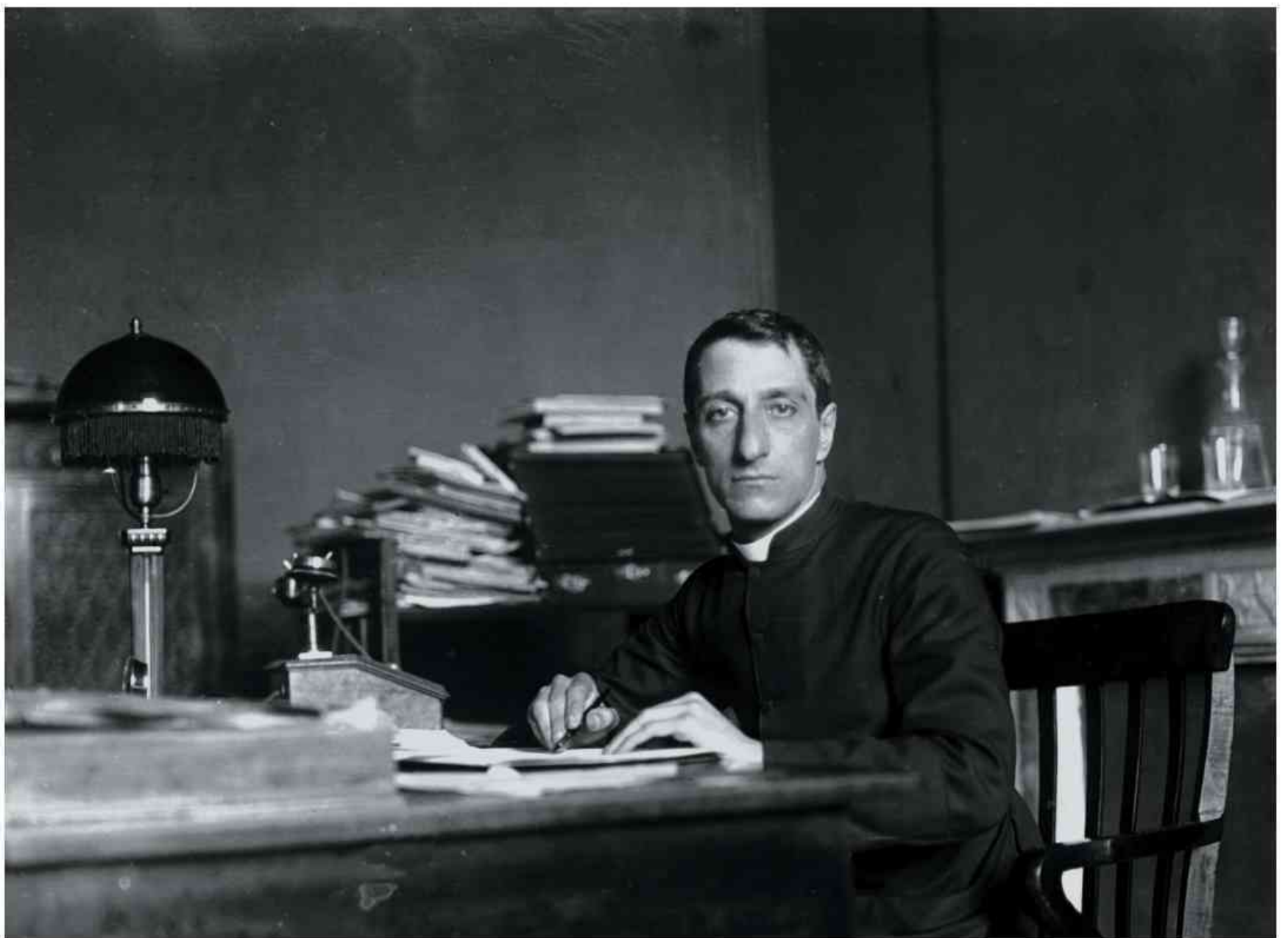
Don Luigi Sturzo (1871-1959) vedeva nell'Italia unitaria un "vestito" che enfatizza i vizi e non le virtù delle sue popolazioni

disegno politico, per riportarci a Sturzo, quello vero. Il sacerdote di Caltagirone incarna una delle strade non prese dalla nostra storia. Alle elezioni del 1921 il Partito popolare ottiene il 20%, più dei Blocchi nazionali in cui sono confluiti i fascisti. Sturzo e Mussolini sono, ciascuno a suo modo, fuoriclasse della politica. Ognuno parla a e di un popolo. Per il futuro duce del fascismo, quest'ultimo è un «organismo in cui l'insieme è superiore alla somma delle parti e in nome di tale superiorità chiede sacrifici umani che assumono il nome pomposo - Sturzo userà l'espressione "untuoso" - di