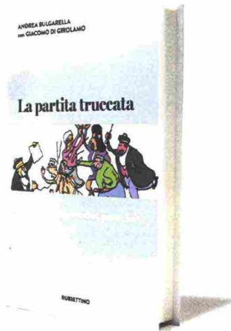
Il libro La partita truccata (Rubbettino, 15 euro) scritto da Andrea Bulgarella e Giacomo Di Girolamo.

dice pure Vittorio Sgarbi che di tutto può essere accusato fuorché di cattivo gusto. Elencarle non servirebbe ma toglierebbe spazio alle indagini, queste sì, malamente assemblate contro Bulgarella.